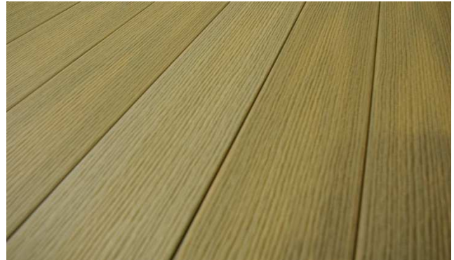
Rozdílný směr pokládky