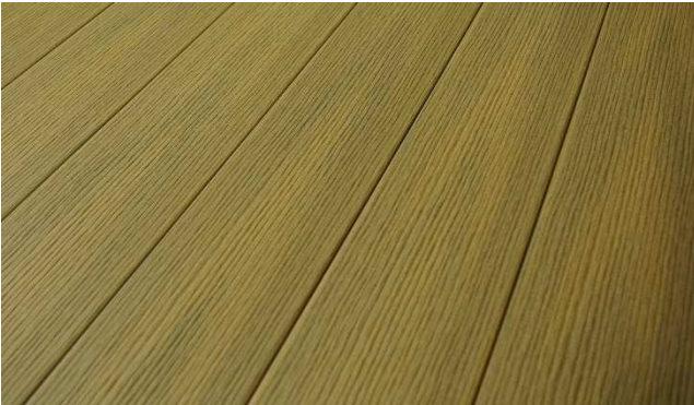
Shodný směr pokládky